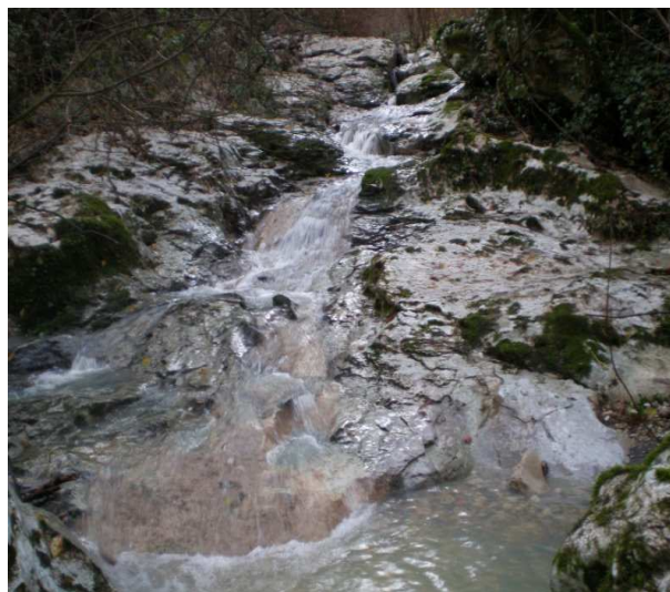
Bellissimo scorcio della forra e dei massi del “Rio Oscuro”

Tra i sentieri naturalistici più suggestivi della Riserva Naturale del Monte Soratte, merita sicuramente una visita il “Rio Oscuro”.