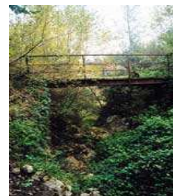
Il vecchio ponte

Nel bel mezzo del fitto bosco, è ancora oggi possibile osservare i ruderi di un'antica fornace di mattoni (foto sopra), un bellissimo esempio di "archeologia industriale" del nostro territorio: questa struttura era utilizzata per la cottura dei laterizi, ricavati dall'argilla circostante. Il trasporto veniva effettuato tramite muli o asini; un vecchio ponte, tuttora presente, serviva ad attraversare la forra. Lo scenario è arricchito, alla base, da caratteristici massi: questi, nei giorni di pioggia, vengono percorsi da rivoli che creano delle meravigliose cascate il cui rumore, immersi tra il silenzio del bosco, risuona come un piacevole canto; l'aria è satura di umidità e, soprattutto nella stagione autunnale, carica di odori. Per chi ama la tranquillità, i suoni ed il contatto con una Natura intatta, è davvero un'occasione da non perdere.